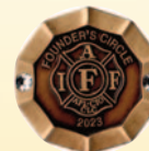
Cercle du fondateur 200 $