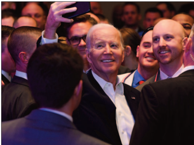
Le président Biden a passé près d'une heure à rencontrer les membres derrière une corde après son discours.

Tout au long de son discours, M. Biden a abordé de nombreuses questions législatives clés pour lesquelles les membres de l'AIP étaient venus à Capitol Hill pour plaider. « Votre travail est une question de dignité et de respect », a-t-il dit.