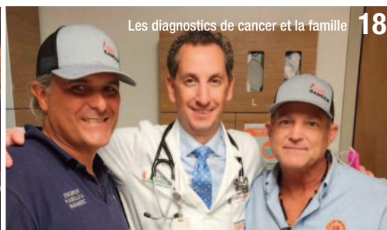
Les diagnostics de cancer et la famille 18