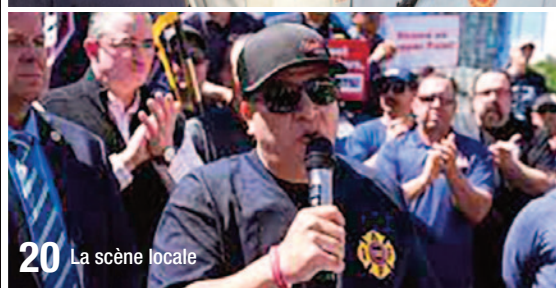
20 La scène locale