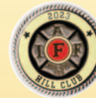
Club de la Colline (Canada) 50 $