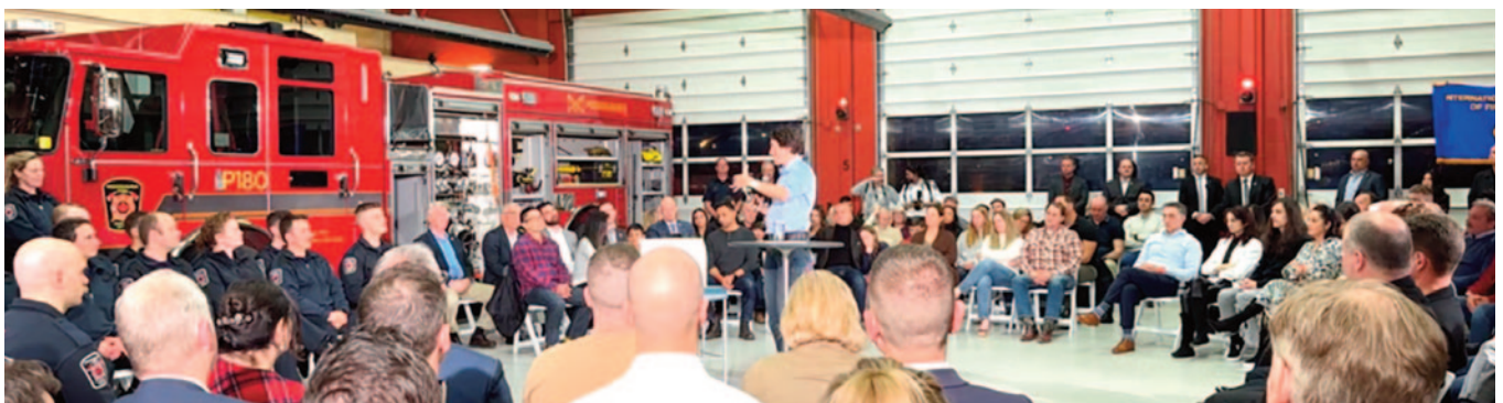
Le Premier ministre canadien Justin Trudeau au forum politique.

En 2017, les libéraux ont également proclamé le deuxième dimanche de septembre Journée commémorative nationale des pompiers en l'honneur des pompiers décédés dans l'exercice de leurs fonctions. ■