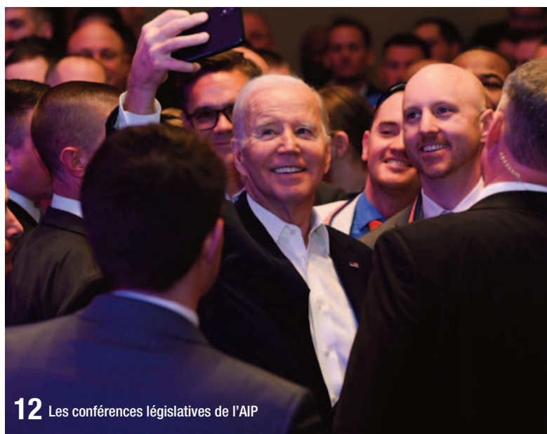
12 Les conférences législatives de l'AIP